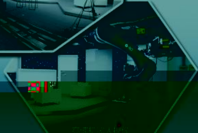
影视多媒体制作室